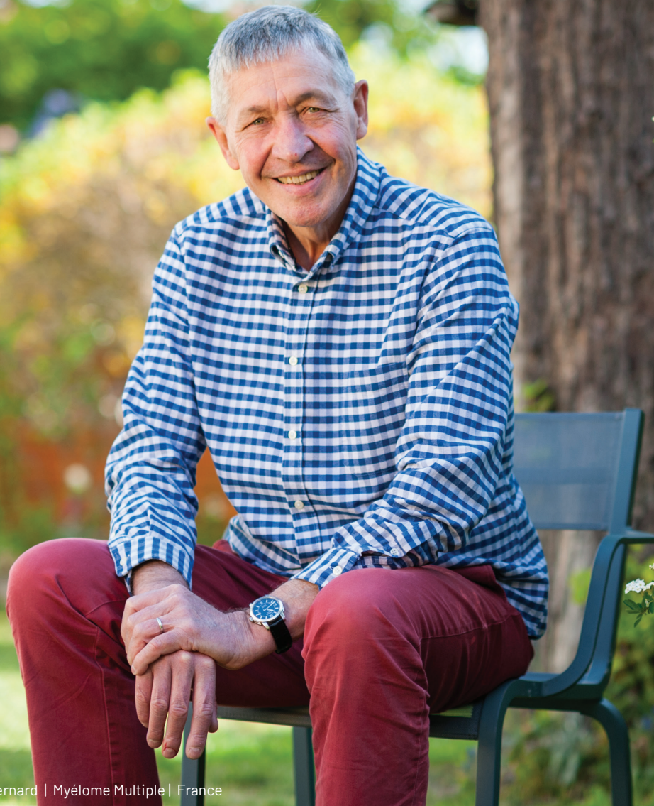
Bernard | Myélome Multiple | France